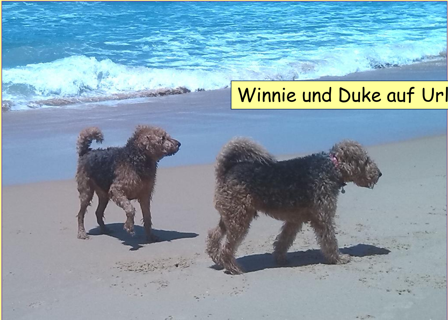
Winnie und Duke auf Urlaub