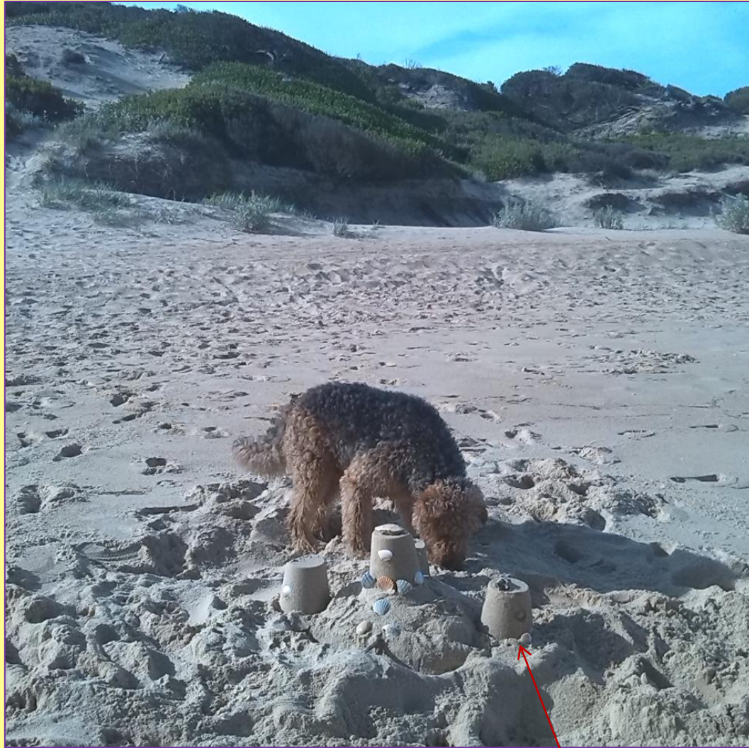
Duke schnuppert an der Sandburg.